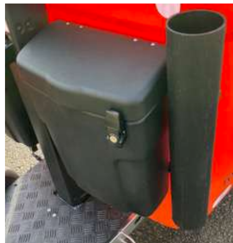
Slotjes op kleine koffers - Grijpstokhouder