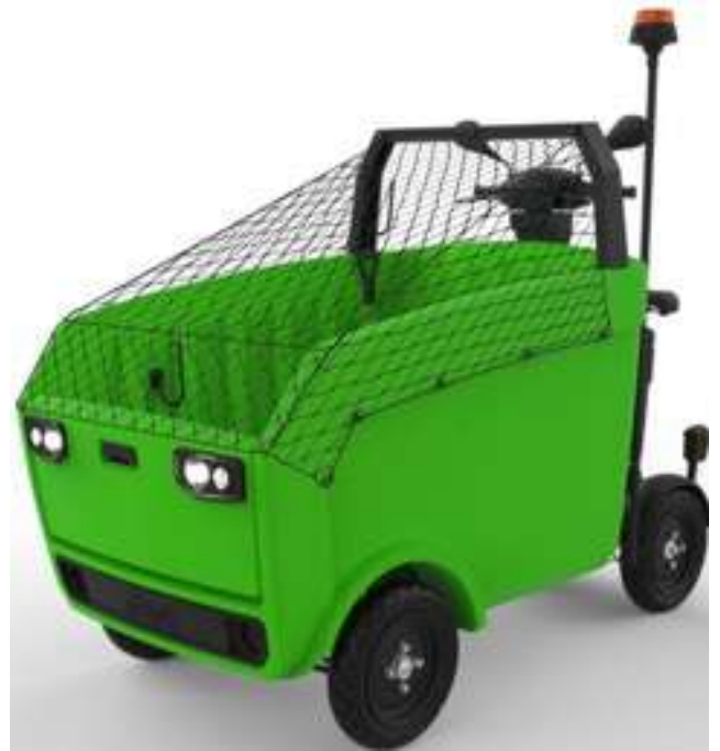
Werkbeugel - Bladnet - Flitslicht