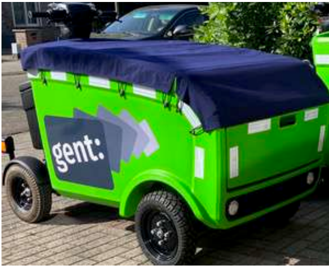
Softcover - 3M stickers